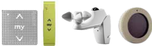
Beispiele für Funksender und Sensoren: Funk-Wandsender smooove Sítuo 1 io Metal green Soliris Sensor LED RTS - Sonnen- und Windfühler mit Kabelanschluss Sunis RTS - Sonnensensor für RTS Antriebe

Zur Bedienung steht eine breite Palette von Funksendern zur Verfügung, die von der einfachen 1-Kanal-Steuerung bis hin zu Steuerungen für bis zu 40 Antrieben reicht. Verschiedene Design-Linien bieten den passenden Look für jeden Verwendungsort.