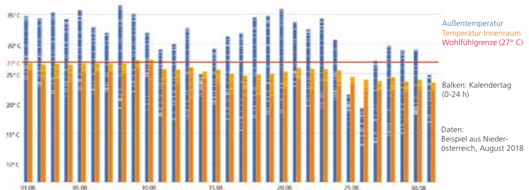
Grafik: Temperaturentwicklung Außentemperatur versus Innenraumtemperatur (Wohnraum, Erdgeschoß, textile Screens mit Soltis 92-2047)

An den heißesten Tagen konnte eine Differenz von bis zu 11°C zur Außentemperatur gemessen werden, die "Wohlfühlgrenze" von 27°C wurde nur an zwei Tagen (09.-10.08.) geringfügig überschritten.